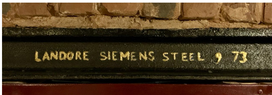
Фото 3. Рельс выпущенный компанией «Landore Siemens steel» в сентябре 1873 г. (фрагмент)

Первый английский рельс является продукцией крупнейшего английского сталелитейного завода из города Ландор в Уэльсе. Маркировка «LANDORE SIEMENS STEEL 9 73» (фото 3) указывает на то, что изделие было выпущено компанией «Landore Siemens steel» в сентябре 1873 г. На территорию Российской Империи стальные рельсы европейских производителей начали массово завозиться с 1873 года [см. 3-4], поэтому можно смело утверждать – этот рельс из первых партий импортного высококачественного металлопроката.