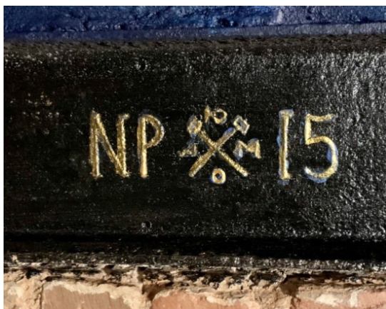
Фото 5. Стальная двутавровая балка с клеймом Донецко-Юрьевского металлургического общества (фрагмент)

Сложность датировки по клеймам на металлопрокате заключается в том, что по ним определяется лишь изготовитель продукции и маркировка вида проката, а информация о дате производства, как правило, отсутствует (исключение – рельсы).