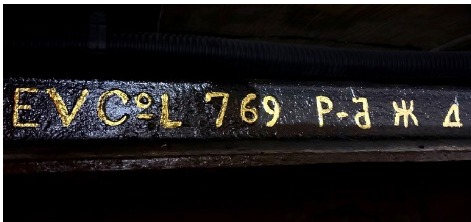
Фото 4. Английский рельс, произведённый в июле 1869 года (предположительно, заказчик – Рыбинско-Бологовская железная дорога)

Рыбинско-Бологовская железная дорога начала строиться 19 сентября (1 октября) 1868 года. Строить железную дорогу пригласили зарубежную фирму «М. и А. Левстам и К». 29 января (10 февраля) 1869 года было согласовано направление дороги на Бологое, а также был утвержден устав «Общества Рыбинско-Бологовской железной дороги». Срок владения дорогой назначался в 85 лет, капитал Общества определялся в 19,3 млн руб. в виде акций [5, с. 35-36]. Биржевой комитет акционерного общества находился в Рыбинске на Крестовой улице и в Санкт-Петербурге. В сентябре 1869 года началась укладка рельсов, которая была завершена в апреле следующего года, и было открыто служебное движение на всём протяжении дороги. Для постоянного движения железная дорога была официально открыта 4 (16) июня 1870 года [6].