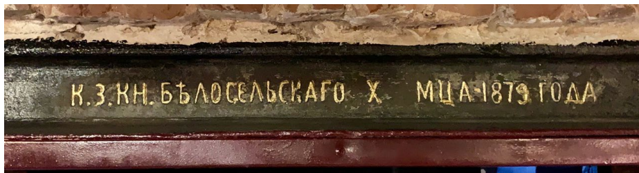
Фото 2. Рельс, изготовлен на казённом заводе князя Белосельского-Белозёрского в октябре 1879 г. (фрагмент)

Отечественный образец имеет на шейке клеймо «К. З. КН. БЪЛОСЕЛЬСКАГО Х МЦА 1879 года» (фото 2). Рельс был изготовлен на казённом заводе князя Константина Эсперовича Белосельского-Белозёрского в октябре 1879 г. Катав-Ивановский чугуноплавильный и железоделательный завод К. Э. Белосельского располагался в Уфимском уезде Уфимской губернии.