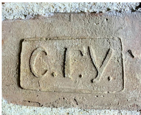
Фото 2. Кирпичное клеймо заводов Самарской городской управы первой половины XIX века

Безусловно, основными материалами, на основании которых и решается вопрос о датировке здания или его отдельных участков являются архивные документы: планировки участков, купчие на приобретение недвижимости, ранее выполненные историко-архитектурные изыскания. Однако нередко перечисленные материалы либо отсутствуют, либо указанные в них данные не могут дать точного ответа на поставленный вопрос [1, с. 62].